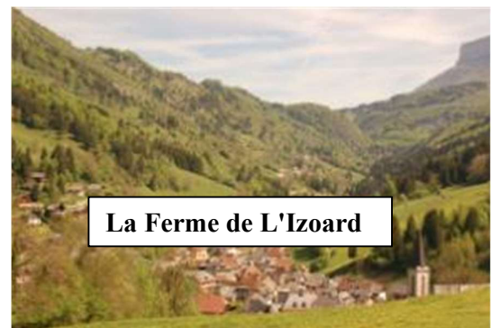
La Ferme de L'Izoard

Départ le jour avant. La première étape étant la plus longue. Dès lors si certain souhaitent déjà avancer le jour avant (donc départ le 8/9. Nous pouvons dès lors vous proposer un hôtel a Contrexéville dans à +- 350 km de Namur et 3.30 heures via l'autoroute. Ceci vous permet de déjà avancer pour la suite de votre parcours. Mais nous proposons aussi une journée de moto complète avec itinéraire via les petites routes au départ de Wanlin.