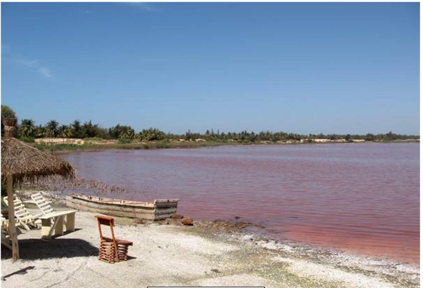
Le Lac Rose et Hôtel le Trarza